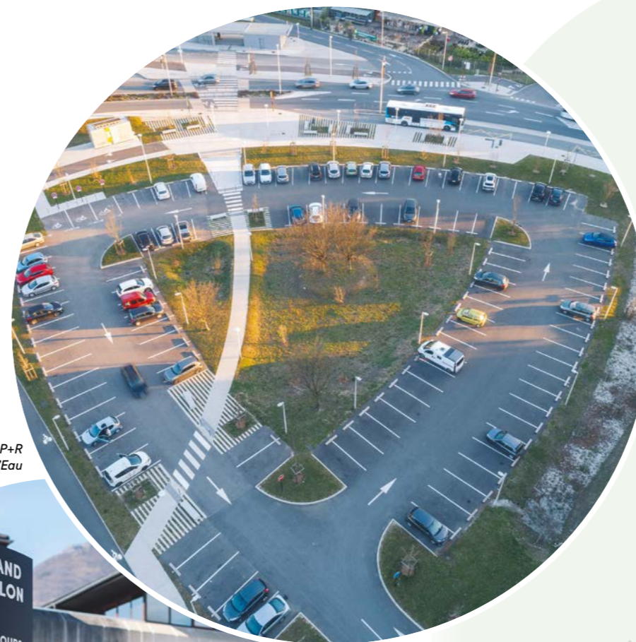
P+R Pré de l'Eau