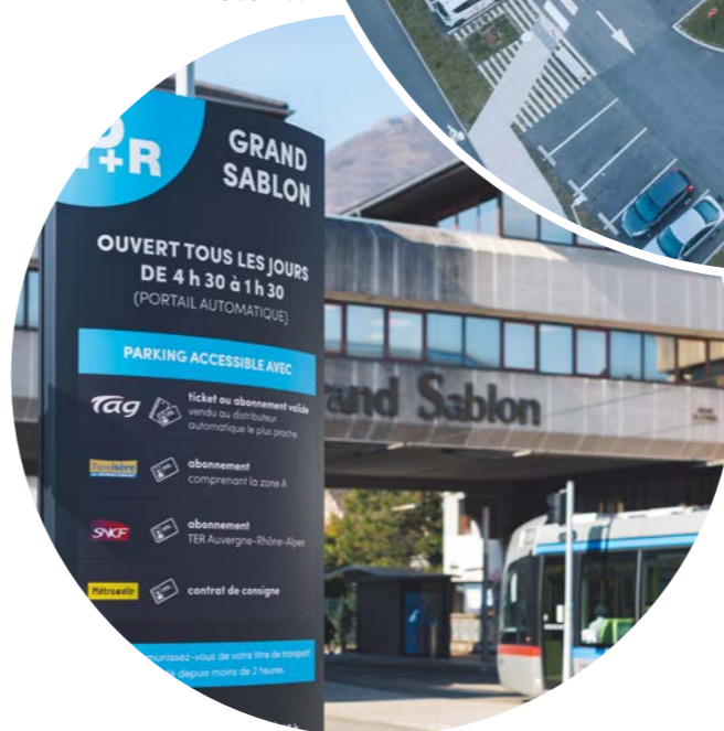
P+R Grand Sablon