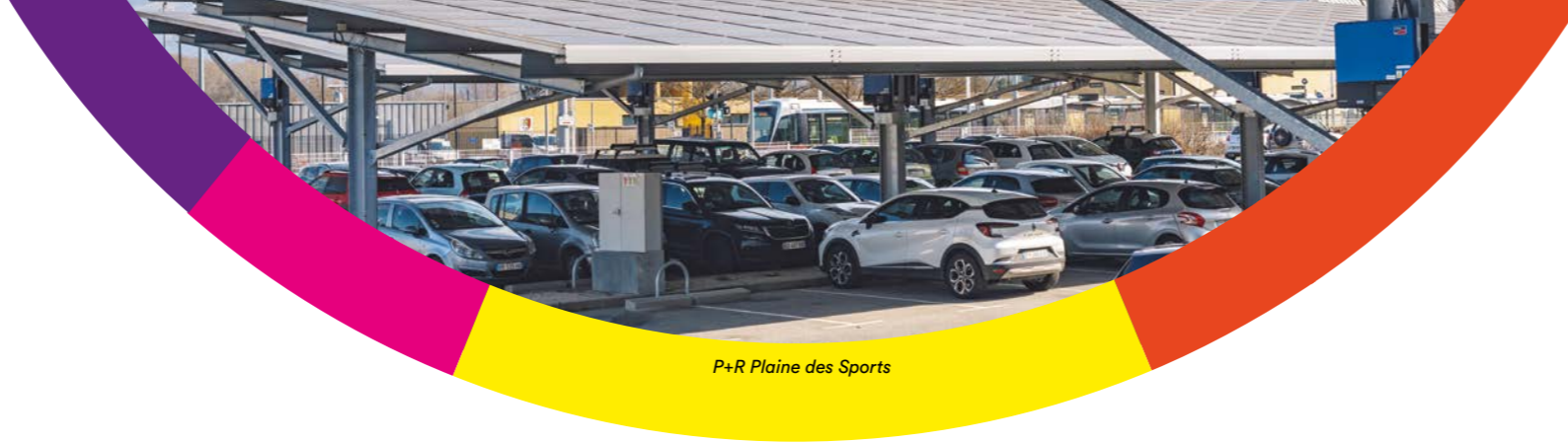
P+R Plaine des Sports